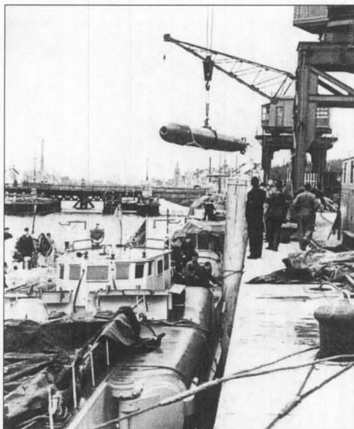
Het laden van torpedo's op snelboten aan de Cockerillkaai

De Engelse MTB17 (motortorpedoboot) wordt op maandag 21 oktober 1940 door het 7.5 cm geschut van de kustbatterij Saltzwedel Alt uit Mariakerke onder vuur genomen en getroffen. Ze wordt door haar bemanning, die overstapt op een andere MTB, verlaten. De volgende dag wordt de boot, waarvan de achtersteven weggeschoten is, in Oostende binnengesleept. Ze ligt daarna, tot het beëindigen der vijandelijkheden en nog enkele jaren erna, verlaten op een hellend vlak achter de vismijn tot ze tot schroot verwerkt wordt.