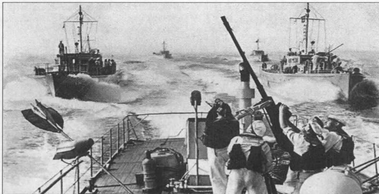
Minenräumbootflottille op oefening.