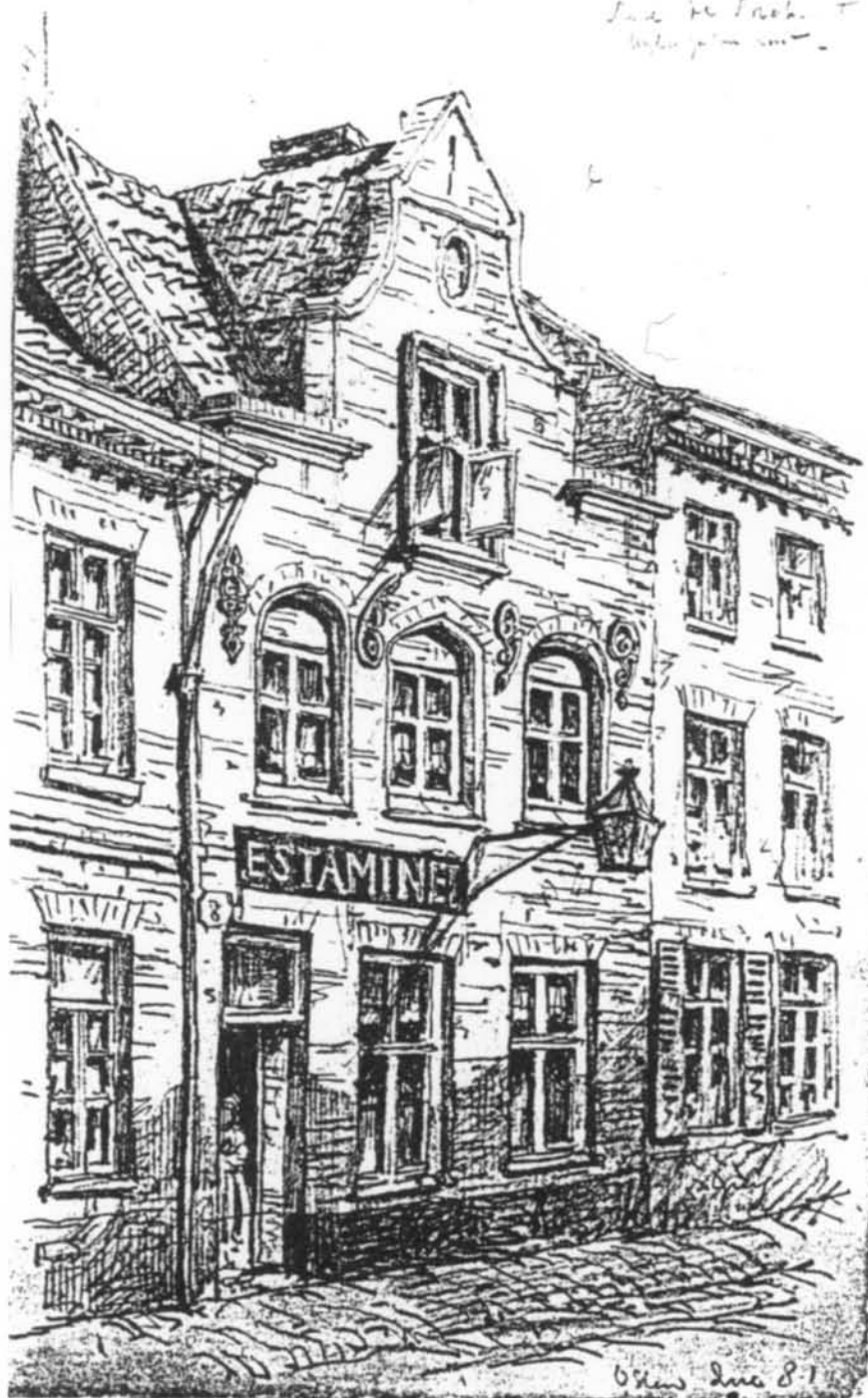
Estaminet "Het Zeepaard" in de Brabantstraat nr. 8 (gedateerd June 1881)