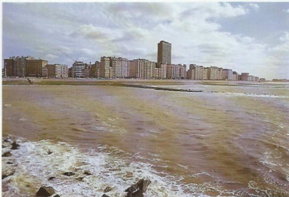
De urbanistische concentraties dienen opnieuw leefbaar gemaakt.