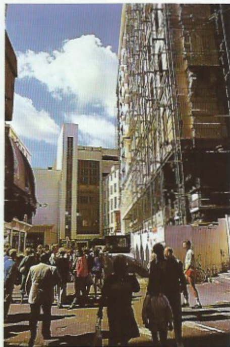
Blankenberge, het einde nabij tenzij ook hier het privé-initiatief de kansen geboden worden om opnieuw te investeren in de toekomst!