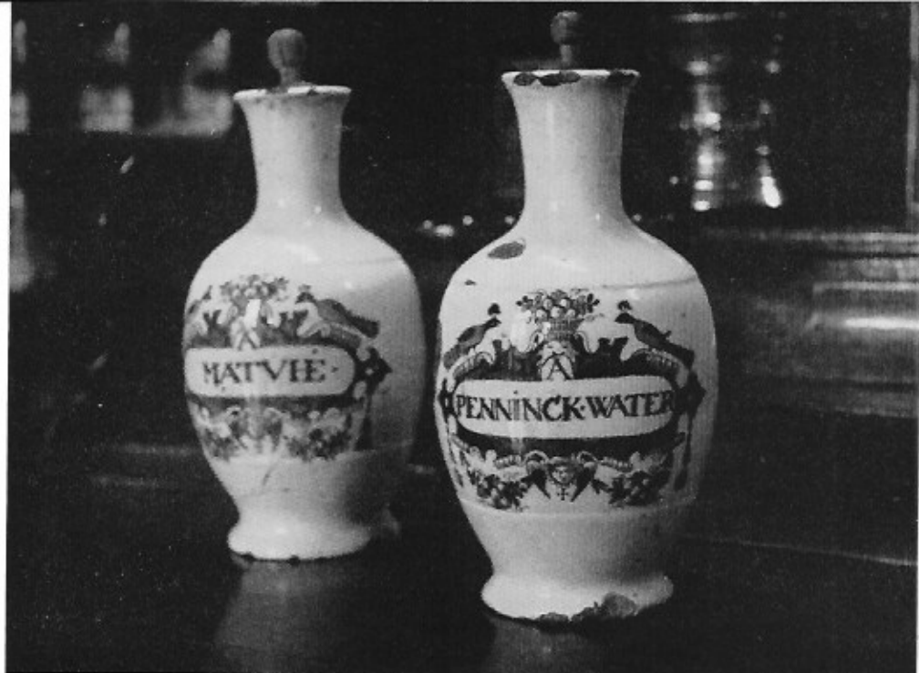
Flessen voor aromatisch water, met Nederlands inschrift A. Penninck water, ongemerkt Delfts aardewerk met pauwenmotief. Verzameling St. Janshospitaal, Brugge.