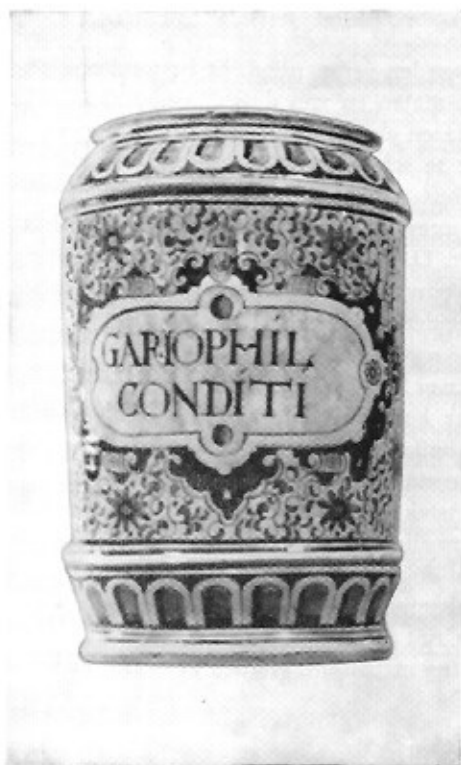
Grote cilindrische pot, hoog 40 cm met het fogliemotief, ongemerkt. Opschrift: Gariophil Conditii. (Cliché uit Delftse Apothekers-potten door D. A. Wittop Koning).