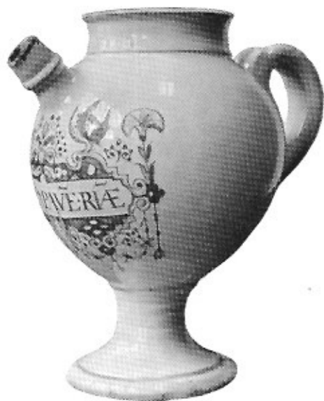
Apothekersfles (zgn. bokspot), in wit plateel; dikbuikig, op voet, met oor en tuit. Versierd met blauw rolwerkmotief, met masker en twee pauwen. Blauw opschrift: S. Depapave. Rhae. Hoogte: 23 cm, diameter basis: 11,5 cm. Verzameling Van Schoor.