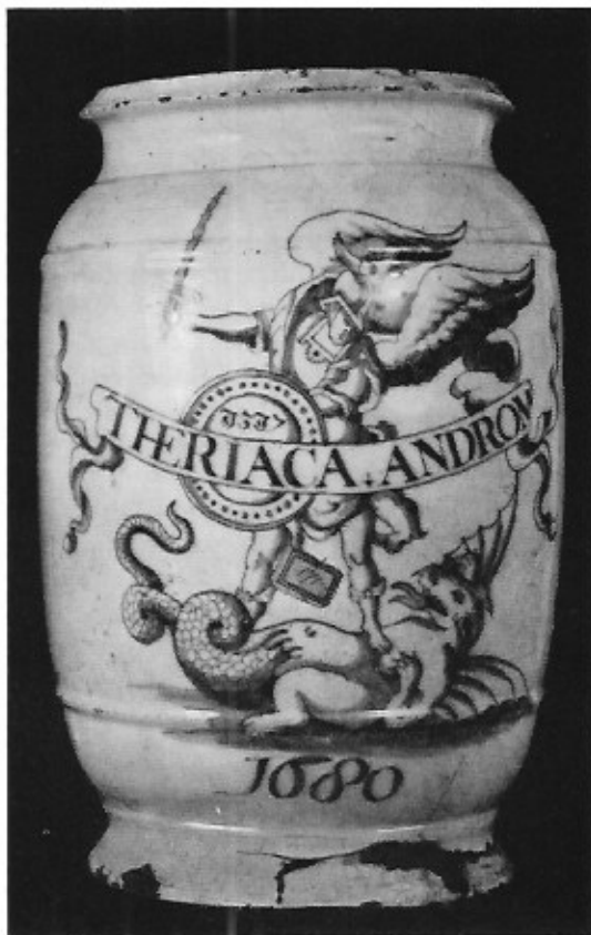
Apothekerspot met cilindervormige buik in Delfts aardewerk. Beschildering in blauw. Vooraan St. Michaël, de draak doënd en banderol met de naam van de inhoud: Theriaca Androm. (theriaca Andromachi). Datum 1680. Hoogte 27, diameter 17 cm. Gruuthusemuseum, Brugge.