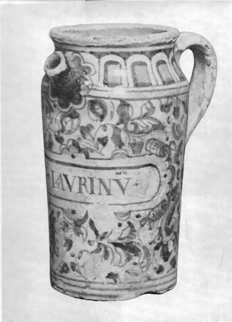
Oliepot met het fogliemotief. De tuit is blauw en loopt uit in een rozet. Benaming: O+LAVRINV+Oleum lauri. (Stedelijk Museum, Breda. Cliché Delftse Apothekerspotten door Dr. D. A. Wittop Koning).

Uit de 17 de en de 18 de eeuw dagtekenen de meest gekende en verspreide ook meest gezochte faiencepotten, de uit geglazuurd aardewerk gebakken zogenaamd Delftse apothekerspotten.