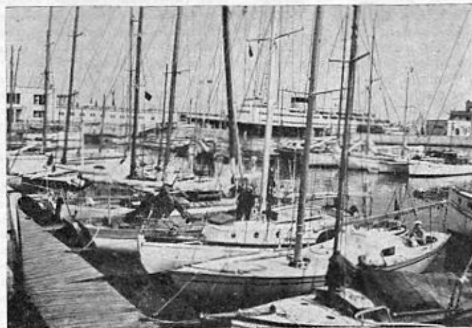
gedeelte van een der beide jachthavens