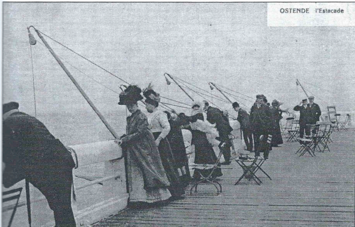
Afbeelding 2. Zicht op het "Hoofd" of het uiteinde van de westerstaketsel. Met behulp van kruisnetten kon het gegoede publiek proberen een visje te verschalken en zich even visser wanen.

Deze wandelstraat in zee was in de loop van de 19de eeuw the place to be geworden en één van de favoriete wandelingen van koning Leopold II. In een Oostendse brochure van kort na 1900 lezen we dat vissen met de lijn of met een kruisnet vanop het westerstaketsel toen ervaren werd als één van de grote toeristische attracties. Het mondaine publiek kon het visgerei huren voor zowat één frank per uur!