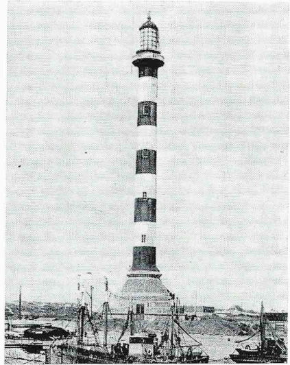
De derde vuurtoren - steeds op dezelfde plaats. Opggericht in 1924, lieten de wegtrekkende bezetters hem springen in 1944.