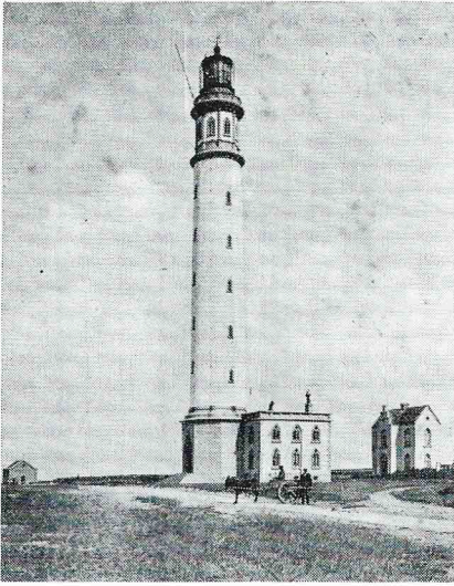
De tweede vuurtoren op de huidige plaats. Hij deed dienst van 1861 tot de vernietiging in 1915.