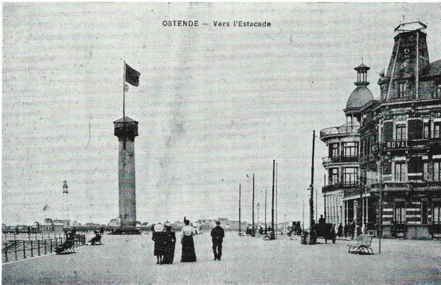
De eerste vuurtoren na de afbraak van de Cercle du Phare. De oorsprong van de naam « de vlaggestok » is hier duidelijk. De toren diende van 1772 tot 1860 en werd in 1944 afgebroken. In de achtergrond ziet men reeds de tweede vuurtoren.