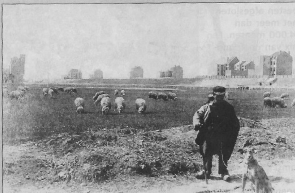
De schaapherder op het middenterrein van de Wellingtonrenbaan.

Op de foto zien we dat al heel wat huizen waren gebouwd op de zeedijk van Mariakerke. Ook het Royal Palace Hotel stond er toen al.