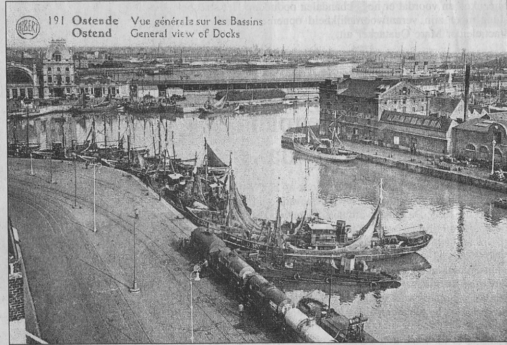
191 Ostende Ostend Vue générale sur les Bassins General view of Docks

Langs de Vindictivelaan en de Visserskaai liep eerlang een treinspoor.