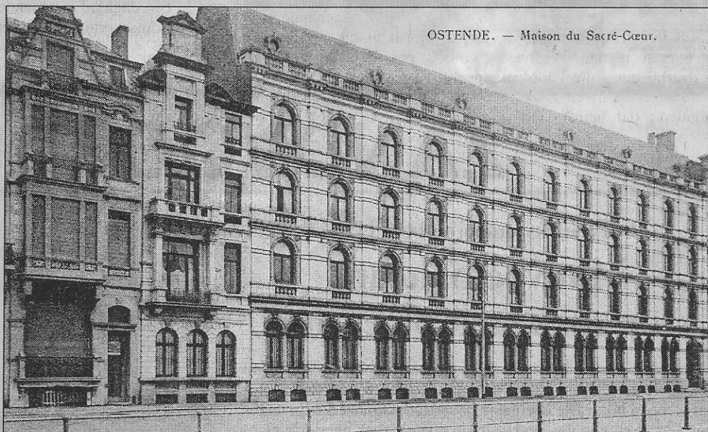
Het pensionaat aan de zeedijk. Honderd jaar later ziet het er nog altijd onveranderd uit.

Honderd jaar geleden werd op de zeedijk in Mariakerke het Maison du Sacré-Coeur gebouwd. Het was het meest prestigieuze pensionaat voor juffrouwen van de hogere standen dat Oostende ooit gekend heeft. Het gebouw was zodanig groot dat het doorliep van de zeedijk tot de Troonstraat.