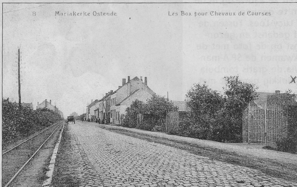
De Nieuwpoortsesteenweg in Mariakerke van voor de Eerste Wereldoorlog, rond 1910.

De eerste prentkaart dateert nog van voor de Eerste Wereldoorlog. De toenmalige Nieuwpoortsesteenweg was nog een kasseiweg met links het tramspoor voor de stoomtram naar Adinkerke in een aparte bedding. De tram was vooral een goederen tram, die wagons met cokes, kolen en andere wrakgoederen vervoerde. Op zijn weg door Maria-