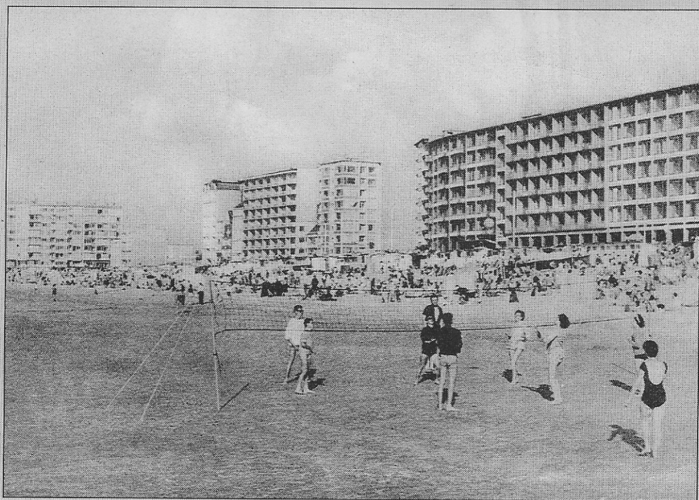
Volleybal op het strand van Mariakerke (1960)

We nemen aan dat de kaart uit de jaren zestig dateert, toen de eerste amateurvolleyballspelers hun verschijning deden aan de kust. Ook de eerste voetbalwedstrijden werden op het strand gespeeld en zo is het strand een enorm speelveld te noemen. Ook hebben de strandtenten hun eigen folkloristische histories in het badseizoen van Oostende en dat telt voor de Oostendenaars.