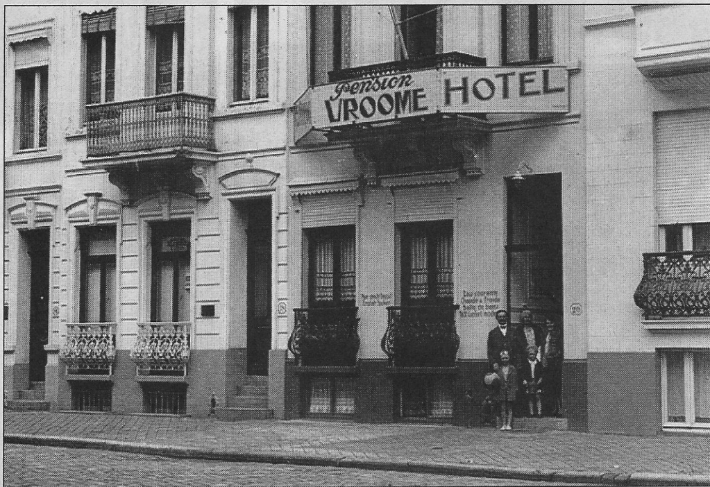
De voorkant van Pension Vroome liet niet vermoeden dat het hotel zoveel kamers telde.

Toen in mei 1940 de stadsbibliotheek op het Wapenplein volledig uitbrandde door de Duitse bombardementen, werd aan de Rogierlaan 14 een voorlopige bibliotheek ingericht. In het huis met nummer 20 vonden in de zomermaanden vele toeristen hun onderkomen aan zee. Wat ons verwonderde was dat we er zeer veel gasten zagen binnenstappen die er voor een hele periode kwamen logeren. „Waar leggen ze die allemaal te sla-