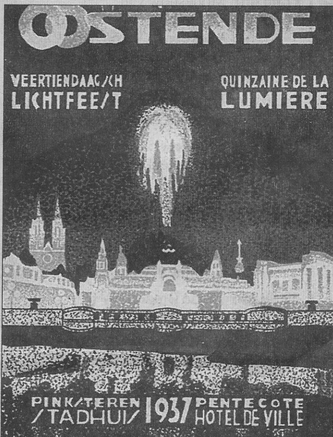
Affiche van het lichtfeest in Oostende (1937).