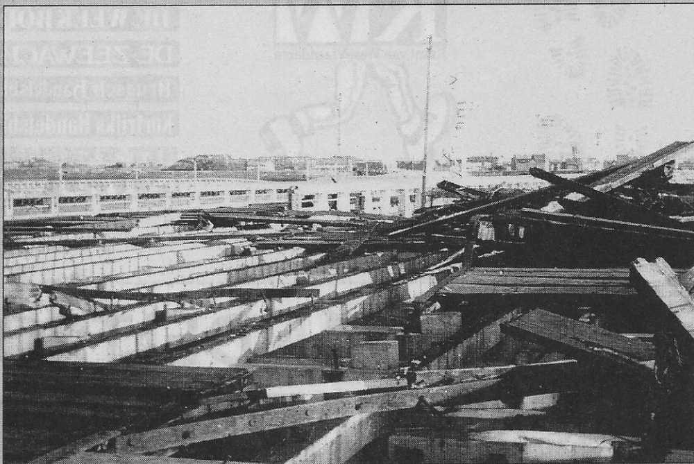
De stukgeslagen staketsels na de storm en overstroming van 1 februari 1953.

In de oude kranten die tussen 3 en 7 februari 1953 verschenen, pikten we enkele anekdotes uit. Een zaak blijft ons nog steeds onduidelijk: de verdrinking van een peuter van 19 maanden nabij het oosterstaketsel. In een krant lazen we volgend verslag: Henri Degryse uit de Vrijhavenstraat 84 kwam een aan-gifte doen dat de vrouw Léontine De Baets met haar 19