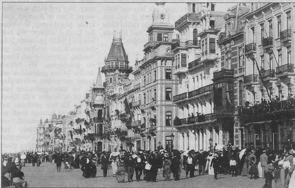
Een zondagnamiddag op de zeedijk.

Dat deze albums echte pareltjes zijn, bewijzen deze twee foto's. Ze zijn evnewel bijna onvindbaar. Misschien moeten we op zoek gaan in het buitenland, want het waren de buitenlandse toeristen die een dergelijk souvenir d'Ostende meenamen. Tussen het uitbrengen van die albums en vandaag ligt evenwel meer dan 100 tot 125 jaar en Europa heeft intussen twee wereldoorlogen met veel vernielingen gekend.