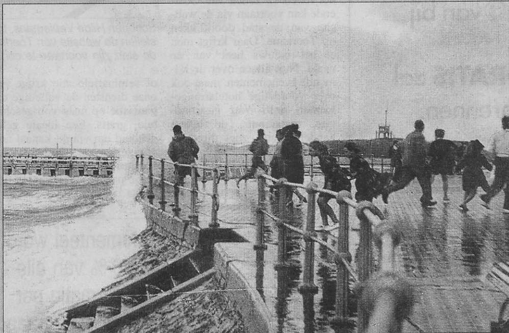
Wie zich bij zware storm te dicht waagt, moet als eens weglopen voor een opspattende golf (1956).

Mooi weer of storm, de mensen houden in alle omstandigheden van de zee. De zee blijft een eeuwige aantrekkingspool. Zelfs als er gevaar dreigt.