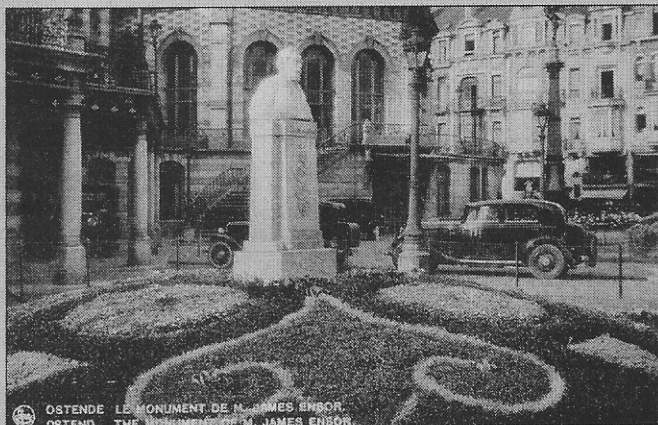
Het borstbeeld van Ensor voor het kursaal (1930-1943)

Bij de heraanleg van een deel van de grote toegang tot het Leopoldpark werd het Bloemenuurwerk verplaatst. Er kwam een groter plein zodat het beeld van Ensor weg moest. Een nieuwe plaats kreeg het beeld van Ensor op