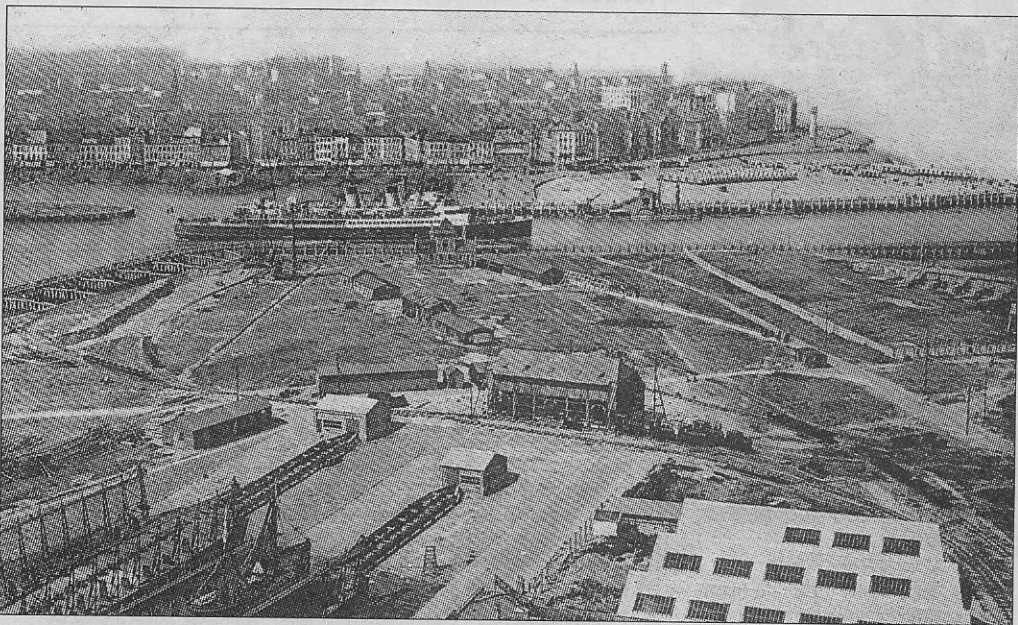
De Oosteroever met de twee slipways en vooraan rechts de werksluizen van Seghers (circa 1935).