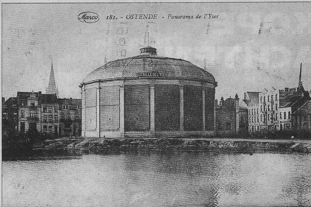
Het gebouw dat tussen Vindictivelaan, Stockholmstraat en het derde dok stond en waar het Panorama van de IJzer te bewonderen was.

In de bijdrage van vorige week hadden we het over de wandelingen die mogelijk zijn op het domein van prins Karel in Raversijde. Daar zijn heelwat overblijfsel van de Eerste en Tweede Wereldoorlog te bezichtigen en er loopt nog tot 11 november een merkwaardige tentoonstelling.