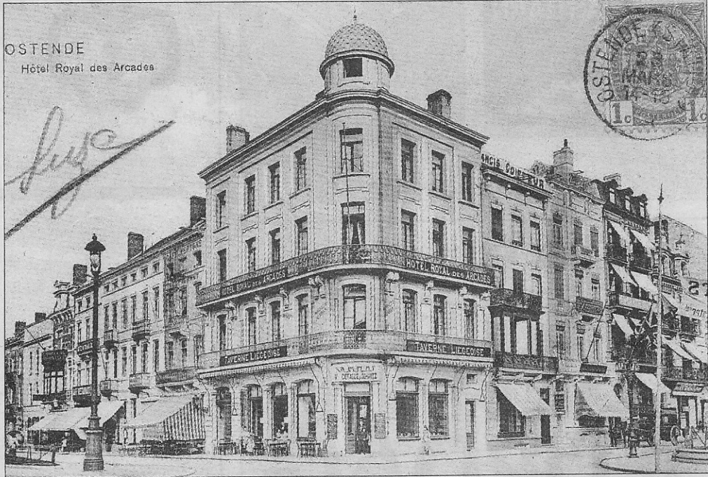
Het Hotel Royal des Arcades op de hoek van de Langestraat en de Leopold II-laan (1905).

Als geboren en getogen iets oudere Oostendenaar is het dikwijls plezant voor de zoveelste keer een verzameling foto's en prentkaarten te bekijken en lang verdwenen zaken te herkennen. Jonge en nieuwe Oostendenaars kunnen de oude gebouwen die er nu niet meer staan, niet meer thuiswijzen, ook al waren ze in het centrum van onze stad gelegen.