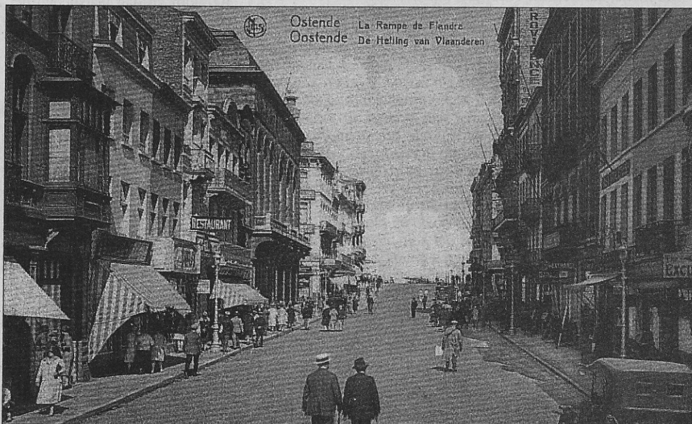
De „Vlaanderenramp” met links de Koninklijke Schouwburg

Door de benaming 'rampe' te gebruiken kon men de plaats onmiddellijk dicht bij de zeedijk situeren. Jongelui ravotten graag met bakjes op wielen in de rampen aan de Visserskaai. De straat behoorde toen nog toe aan de kinderen.