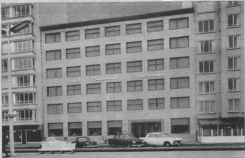
Het heropgebouwde hotel van 1938 in 1952

Louis Vandendriessche had in het begin van de oorlog zelf