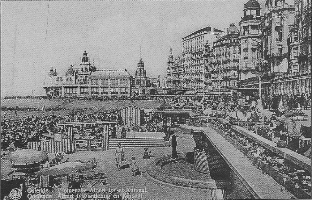
Ostende - Promenade-Albert Ier et Kursaal, Oostende - Albert Ier Wandelweg en Kursaal.