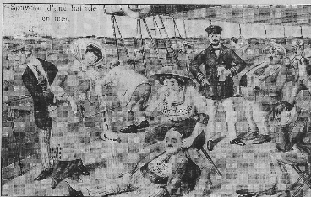
Let op de pintelierende zeebonken

Hierbij laten we een paar kaarten zien, die in Oostende verkocht werden, maar in 1913