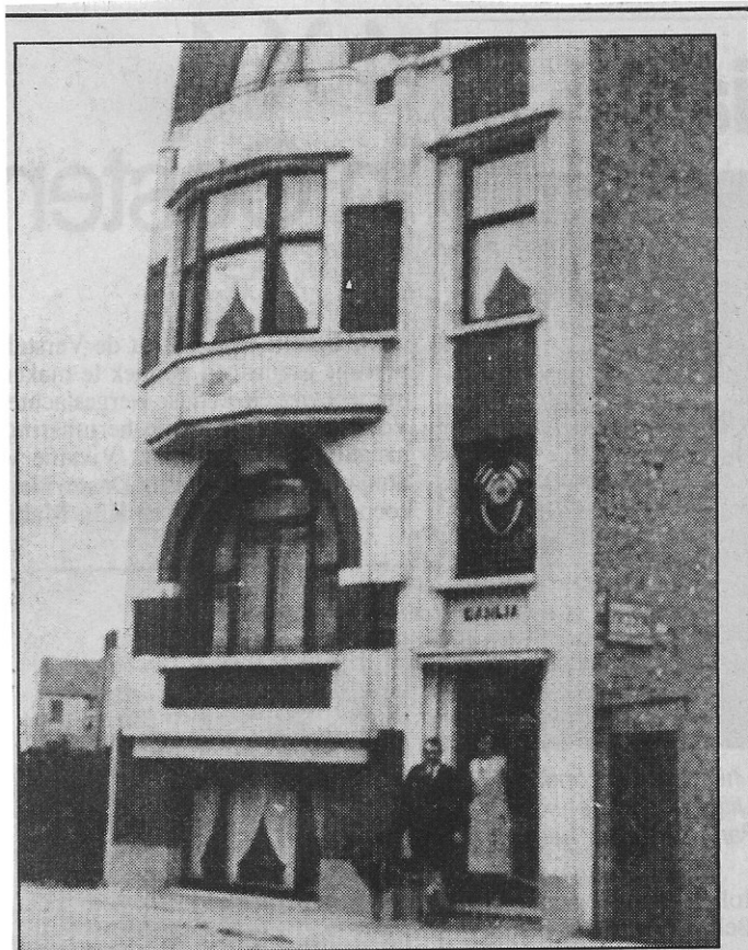
Het familiepension „Villa Dhalia” in de jaren dertig.