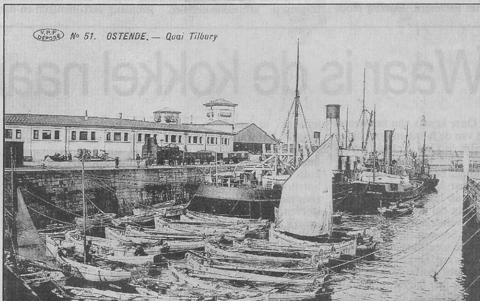
Tilburg-schepen liggen aan de loskade aan de oude Vismijn (1906)

In 1932-33 werden de „Rubis” en de „Topaze” vervangen door de „Améthyste” en de „Turquoise”. Na 1945 was enkel nog de „Saphir”, in 1897 van de werf gekomen, in vaart. De laatste glorieperiode was in de jaren '50, toen werden schepen met dezelfde edelsteennamen in gebruik genomen, nl. de „Diamant”, de „Saphir” en de „Topaze”. In 1957 kwam daarbij de „Rubis” en in 1958 de „Turquoise”. Het waren 5