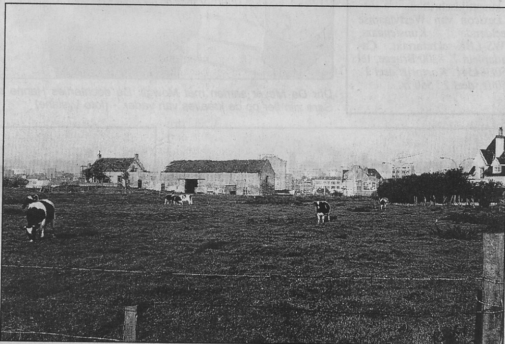
Koeien op de weide van de Hamiltonhoeve (circa 1975)