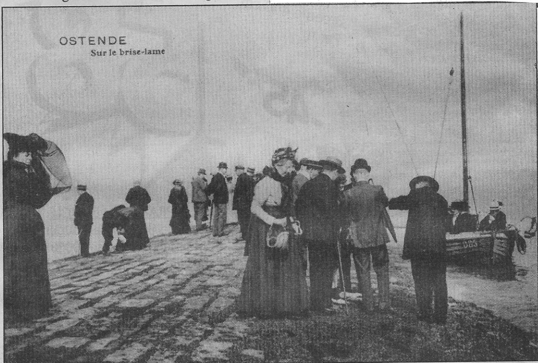
Zondagtoeristen worden met een plezierbootje opgehaald (ca. 1905)