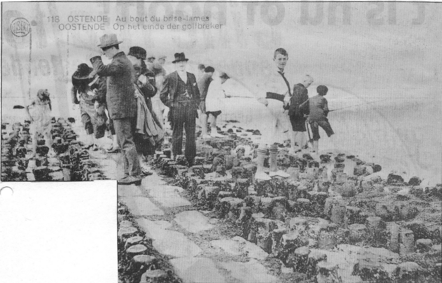
Zeediertjes zoeken tussen de stenen... (ca. 1922)