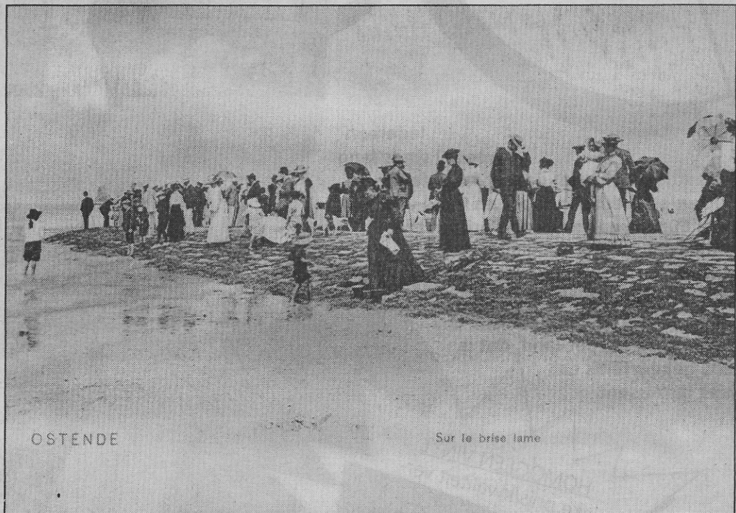
Via de golfbreker een eindje in zee wandelen (ca. 1900)