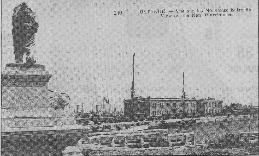
De nieuwe pakhuizen met douanekantoor. (circa 1905)