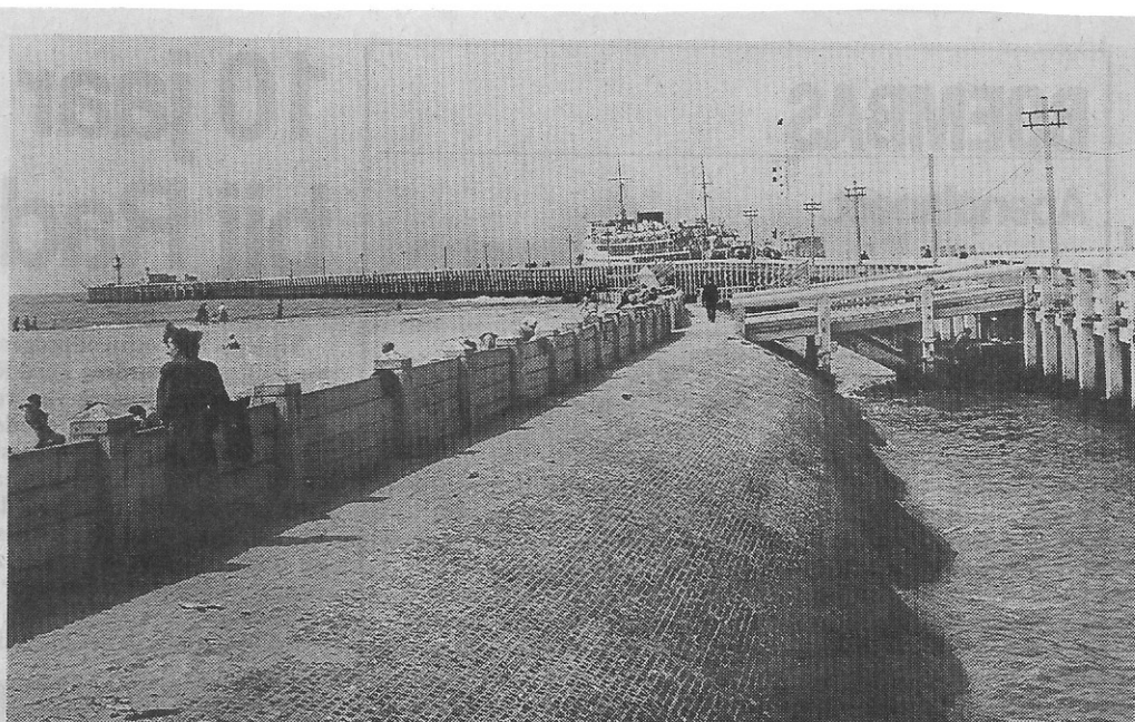
De Bas bij opkomend water. Men ziet het donkere gedeelte van de strekdam, met mos begroeid.