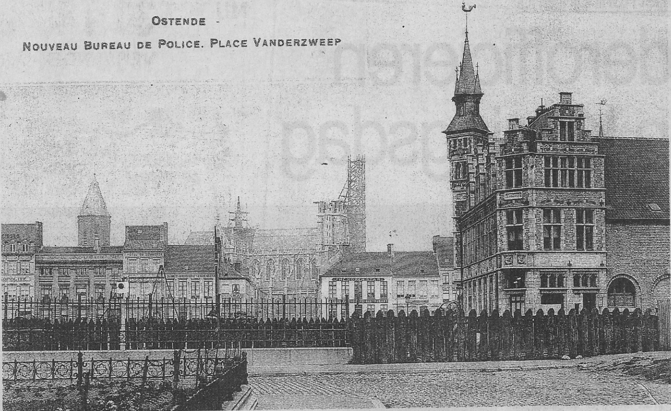
Het pas gebouwde politiebureau op het Hazegras in 1905. Het werd in 1955 afgebroken. Let op de mooie zeemeermin op het uitkijktorentje.