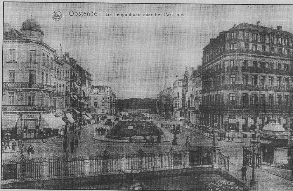
De Leopold-II-laan gezien vanuit het plantsoen dat aan de ingang van het kursaal lag.

Doch alles verandert en de eerste building van Oostende werd nog vóór de Tweede Wereldoorlog op de hoek van het Marie-Joséplein gebouwd. Maar het is vooral in de jongste 25 jaar dat de ene na de andere villa, zoals men vele van deze herenhuisen wilde noemen, afgebroken werd om plaats te maken voor flatgebouwen en hotels.