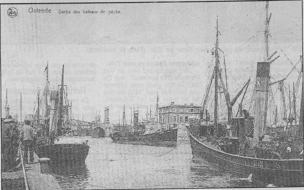
Hetzelfde dok, waar vissersschepen kwamen meren, vooraleer in 1934 er de nieuwe vismijn werd gebouwd. (circa 1926)