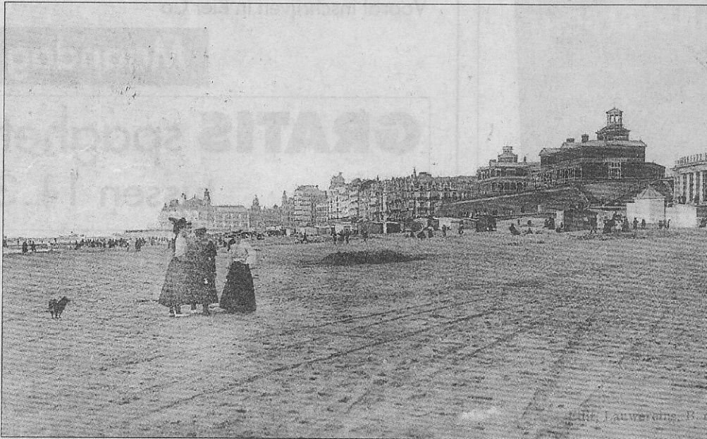
Het hele 'plankendorp', cabines en badkarren, verlaat het strand in september (circa 1910).

Tot daar dit wel kort stukje in de reeks De tijd van toen , maar de fin de saison duurt ook niet lang. Of niet soms ?