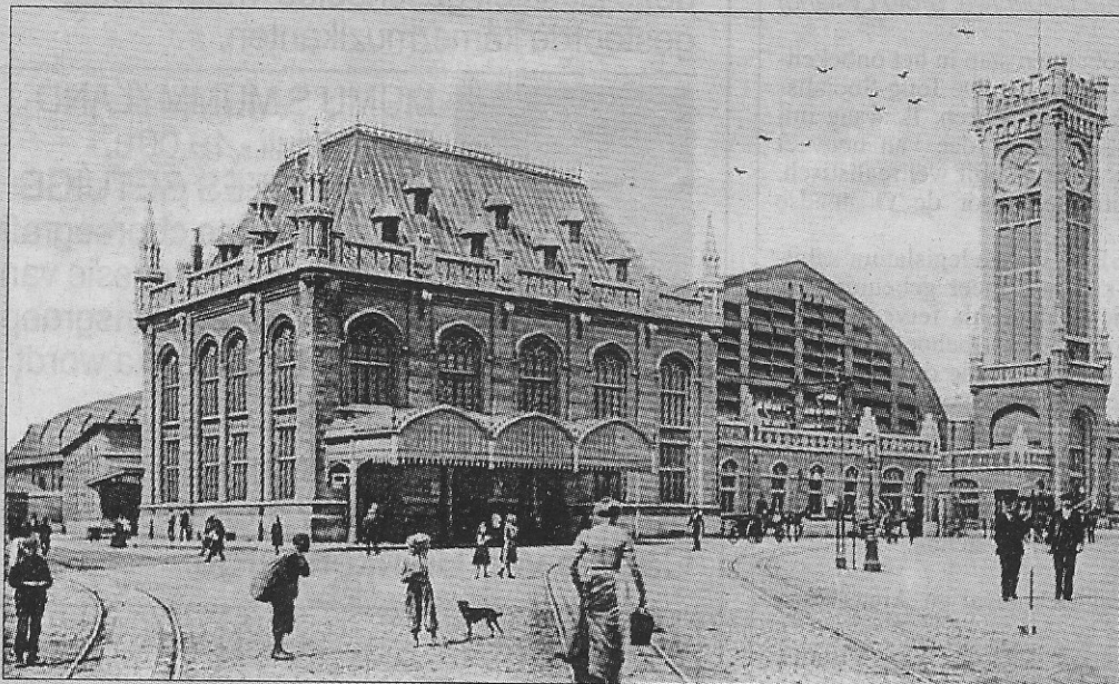
Het oud station van Oostende met links het sorteercentrum van de Post (1905).

Vandaag heeft de telefoon, de fax en het internet veel van de werking van de posterijen overgenomen. Terwijl vroeger de Belgische posterijen tot de beste van de wereld behoorden. Een voorbeeld ter staving. Rond de jaren 50 vroeg een stadhuisambtenaar om 8 u.30 schriftelijk een document aan bij het Provinciaal Bestuur in Brugge. De bode bracht de brief om 9 u.30 naar de Post. De verzending vertrok richting binnenland om 10 u.30. Het Provinciaal Bestuur ontving de brief om 11 u. met de laatste voormiddagpost. Om 14 u. vertrok het gevraagde document richting Oostende. Het kwam om 15 u. aan in het sorteercentrum van Oostende en de namiddagbedeling van de Post bezorgde de brief ten stadhuis om 15 u.30. Om 16 u. belandde het document op het bureau van de stadsambtenaar. Dit verhaal van Fernand Baete, afdelingschef van de dienst secretariaat, is ons altijd bijgebleven. We mochten toen zeker fier zijn op onze Post.