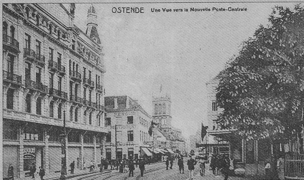
De tramhalte aan het gebouw van Bouchery in 1910.

Ook het centraal gelegen net als het tramhuisje dat al parkje heeft al enkele gedaante-voor de derde of vierde keer veranderingen ondergaan, verbouwd wordt.