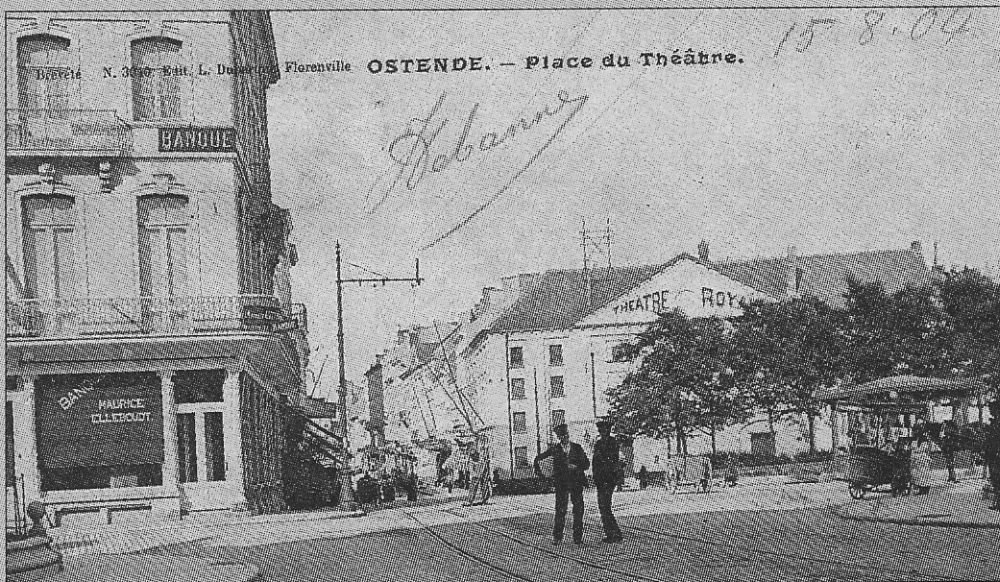
Het Schouwburgplein in 1902 met de Koninklijke Schouwburg.