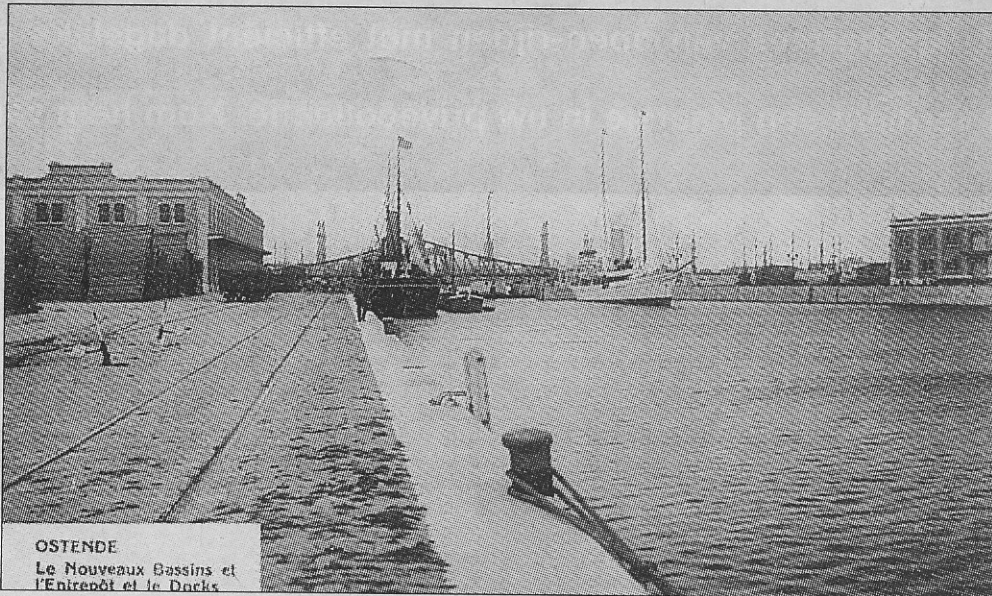
Soms werden de planken dicht tegen de hangars gelost.

Maar de houtnijverheid zorgde ook voor ellende en verdriet. Velen zullen zich nog het drama herinneren van het Oostendse schip dat hout was gaan laden in Scandinavië. Het schip zou nooit meer zijn thuishaven bereiken, want, zonder dat men er nog iets van terugvond, verging het met man en muis.