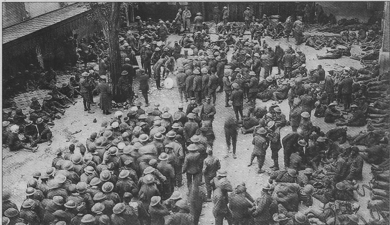
Een beeld uit 1917: Engelse krijgsgevangenen verzameld op de speelplaats van de Albertschool.

Hopelijk zullen de Oostendenaars na een eventuele bescherming weer eens oog hebben voor de statige Albertschool.