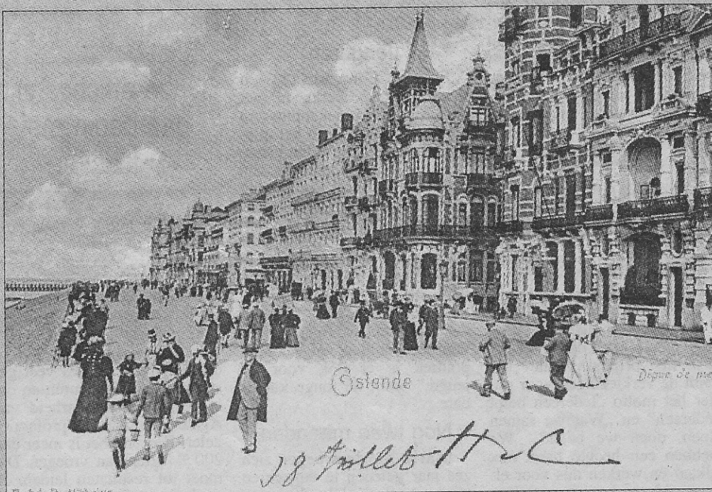
Een zicht uit het jaar 1900. Op de Zeedijk flaneerden de wandelaars, aan de ene kant genietend van de zee en aan de andere kant de mooie gebouwen bewonderend.

Een zin die vele oudere Oostendenaars regelmatig uitspreken is de volgende : „De dijk van vroeger was toch schoon, hé.” Al rijst de twijfel of er nog veel Oostendenaars zijn die zich de Albert I Promenade of Zeedijk van voor 1940 of 1960 nog herinneren. Vergeten we niet dat we daarvoor diep in ons geheugen moeten graven ; bijna 60 of 40 jaar terug.