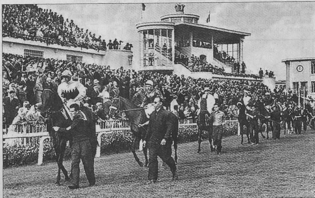
De koninklijke tribune anno 1958.

ook zeldzame exemplaren van de Wellington die tegen hoge prijzen gezocht worden. Tevens denken we dat Oostende met Aimé Desimpel als nieuwe Wellingtonvoorzitter een goede zaak doet.