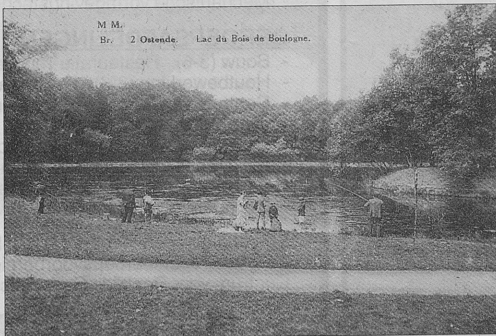
Kruisnetvissers op het staketsel.

denboek kwamen we op een mogelijk spoor.