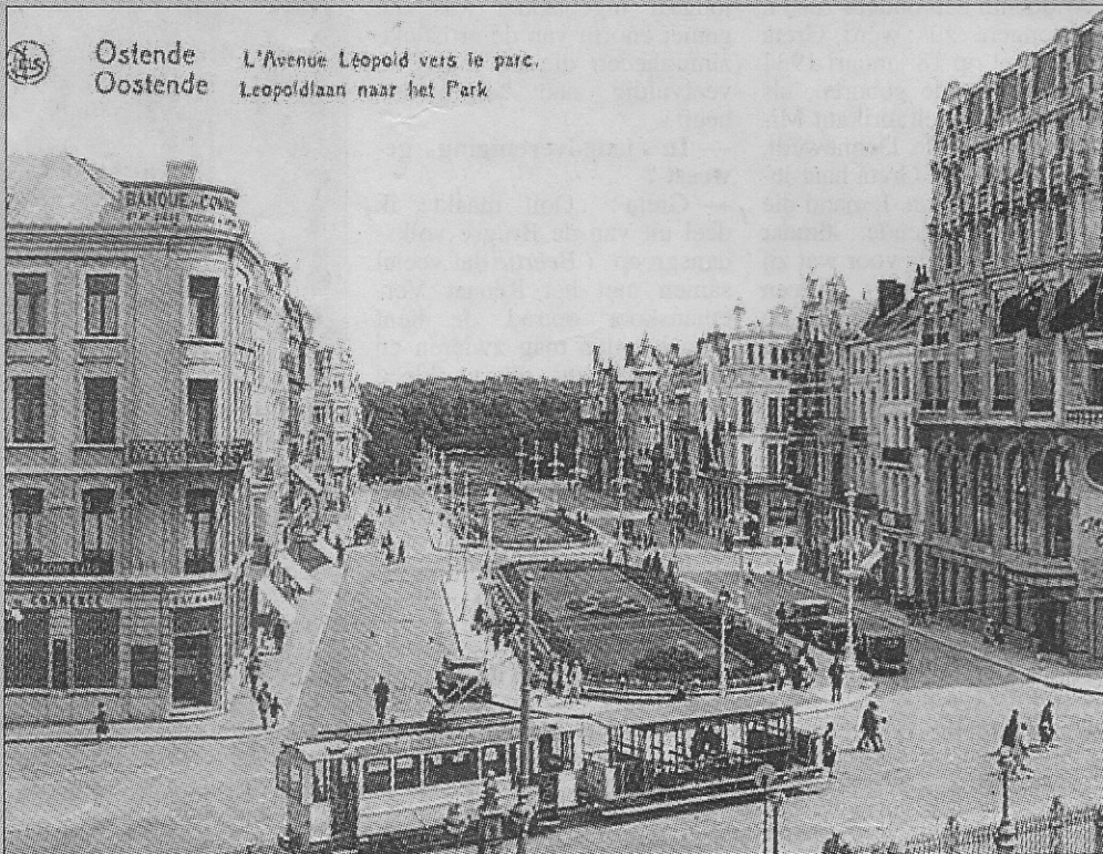
De tram met de open wagons reed alleen in de zomer. Hierboven tegenover het kursaal van Oostende.

De kusttrams speelden en spelen nog een vooraanstaande rol in het toerisme. Denken we maar aan de open trams die naar de hippodrooms van