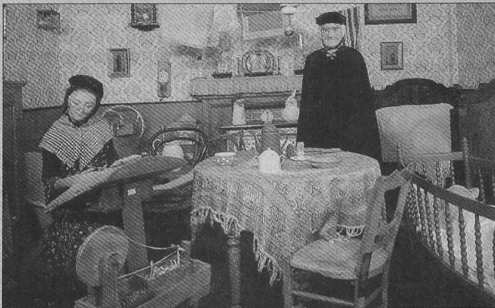
De reconstructie van een Oostendse woonkamer van rond de eeuwwisseling.

We durven hier dan ook een warme oproep lanceren aan alle Oostendenaars die beweren zo van hun stad te houden en zeker ook aan alle Oostendse politici die nog nooit een voet hebben gezet in een van de stedelijke musea, eens een bezoek te brengen aan het heemmuseum van hun stad. Je vindt het heemmuseum De Plate in het Feest- en Kulturpaleis. Met uitzondering van de dinsdag staan de deuren dagelijks open van 10 tot 12 u. en van 14 tot 17 u. In de wintermaanden (vanaf september) is het museum alleen op zaterdag en tijdens de vakanties open.