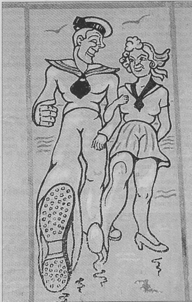
Deze siertegel tooide ooit de installaties van 'Bad en Strand'.

De Oostendse uitgever Photo Tropic , aan de Albert I-Wandeling 66, publiceert momenteel een serie postkaarten die herinneren aan de oude badinstellingen. Ook de merkwaardige prenten van oude siertegels ontbreken niet. We houden er aan één van die kaarten te publiceren, samen met een tekening van het