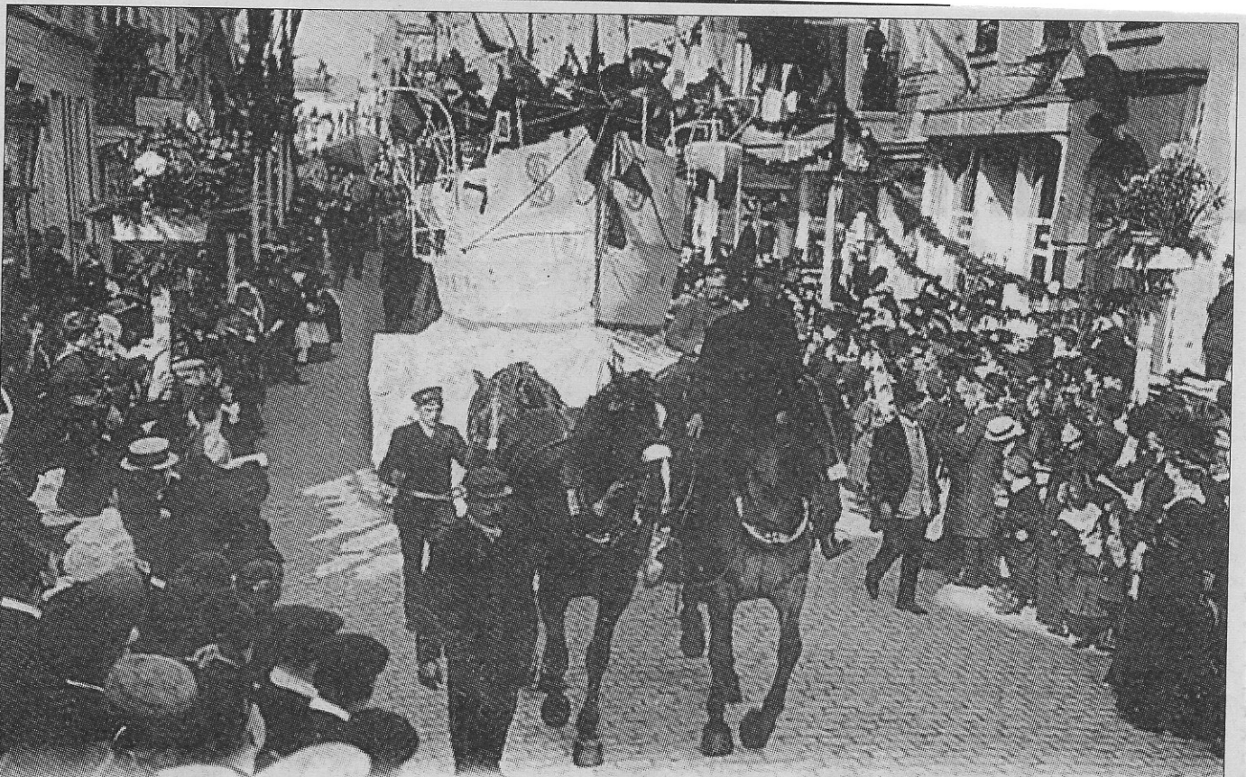
OSTENDE.—Grand cortège déguisé des 7 et 8 Juin 1908. Foyeuse entrée de l'Ibis à Ostende.