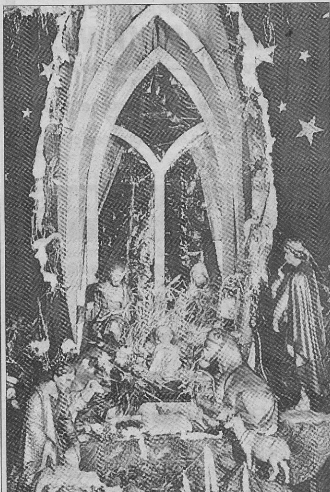
De kerststal in de kerk der paters Dominikanen kort voor de tweede wereldoorlog in 1938.