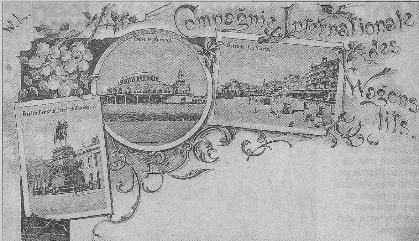
Een Oostendse prentkaart uitgegeven door de Compagnie Internationale des Wagons Lits (1902).