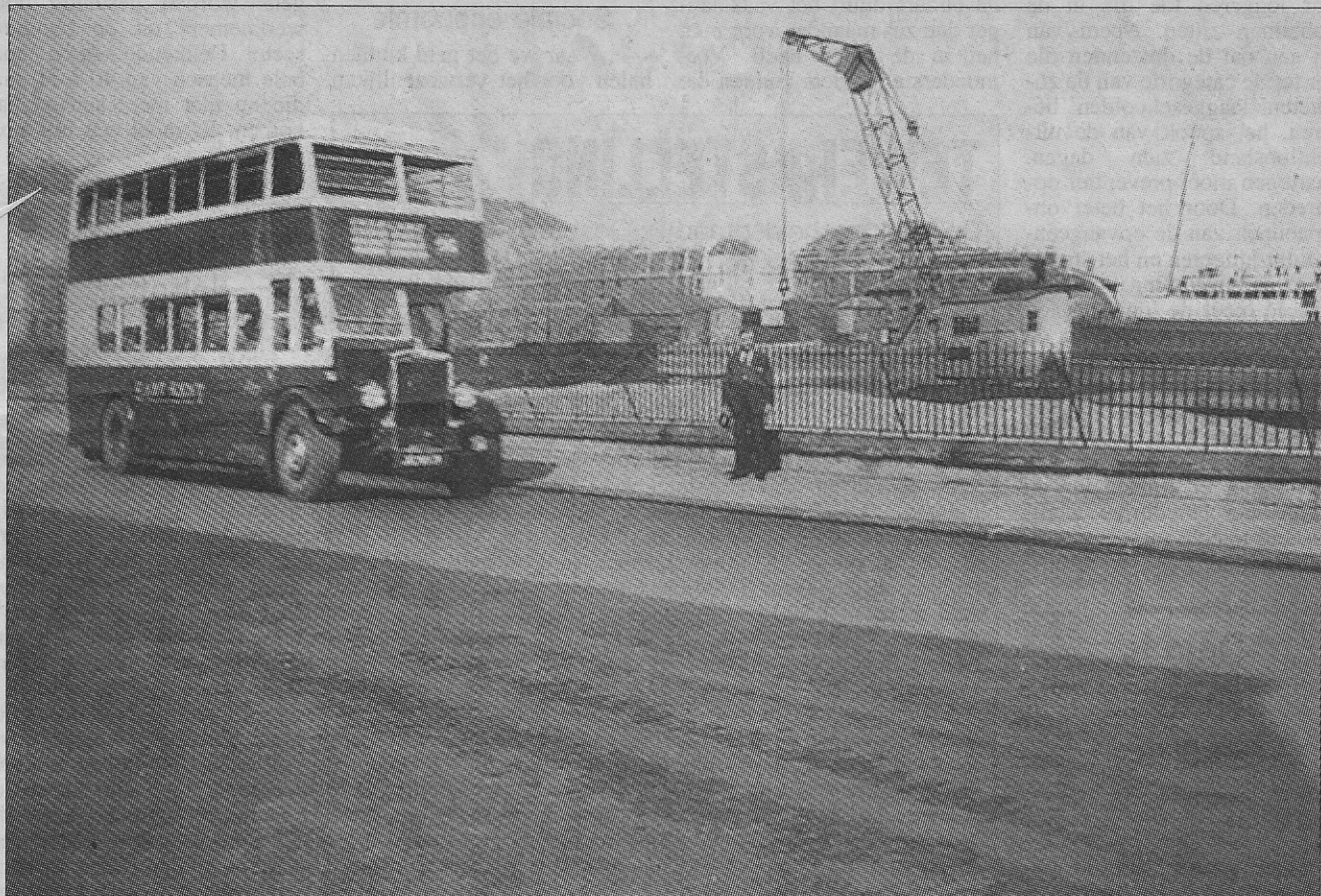
De dubbeldekker wacht op de landing van passagiers in Dover (1935).