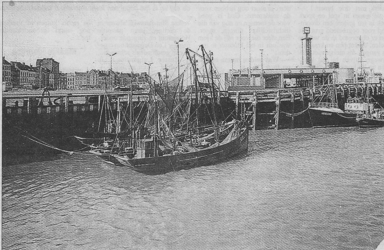
De eerste carferrytoren van voor 1939.

Toen in 1936 de maalboot „Ville de Liège” werd omgebouwd tot carferry die de verbinding mogelijk maakte voor wagens - met de bedoeling van in Londen dwars door Europa te rijden -, werd kort daarop een gebouw neergezet dat als aankomststation moest dienen.