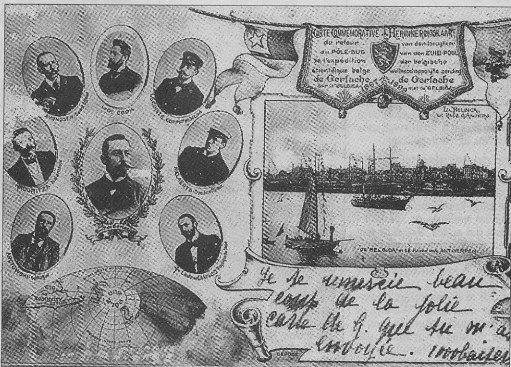
Deze herinneringskaart werd uitgegeven naar aanleiding van de terugkeer van de expeditie.

De 'Belgica' zou voor de feestelijkheden rond de uitbreiding van de haven van Oostende in 1905 naar de kust terugkeren. De veelmaster lag gemeerd in het tweede dok nabij het vroegere station. Tenslotte ook vermelden dat Adrien de Gerlache een officier van de Oostende-Doverlijn was. Ook dat het huidige Belgisch hydrografisch en wetenschappelijk vaartuig 'Belgica' met fierheid de naam draagt van zijn illustere voorganger. Een blijvende herinnering bijgevolg aan een uitzonderlijke expeditie.